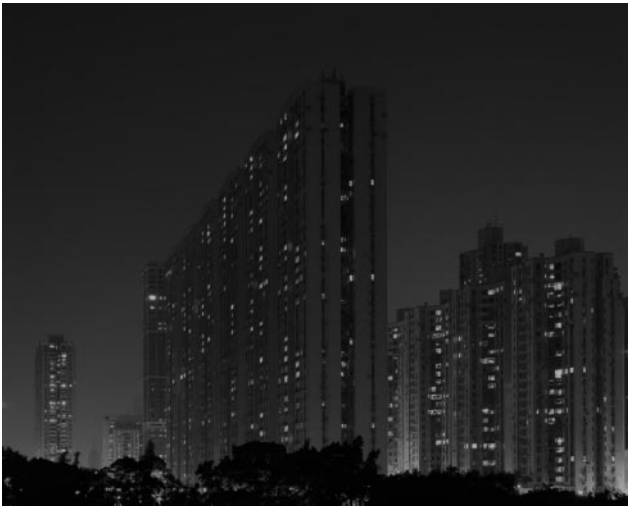
01_ Apartment Buildings at Night, Taipa, 12/01/2006