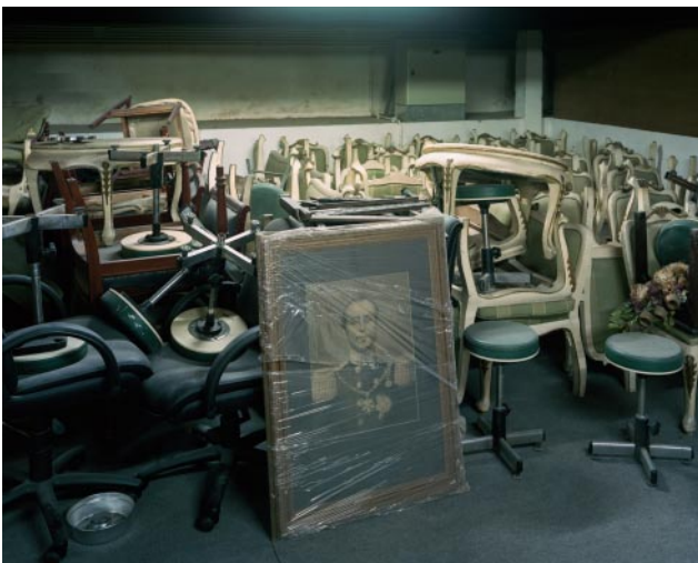
05_ Portrait in the Dom Pedro V. Theatre Basement, 12/12/2006