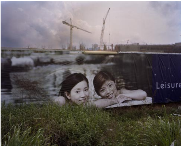
03_ Leisure, 03/30/2007