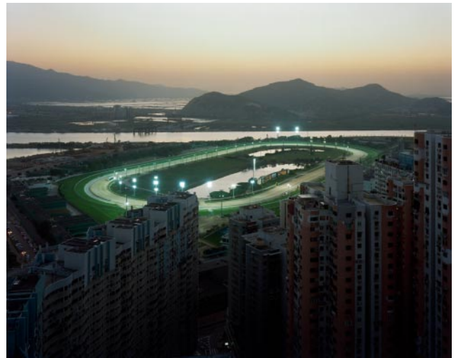
10_ The Macau Jockey Club, 12/17/2006