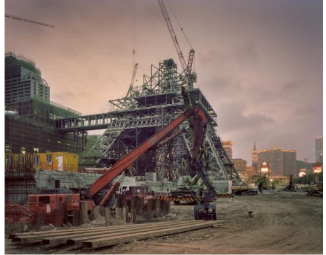
08_ Eiffel Tower, The Parisian Macao, 05/31/2015