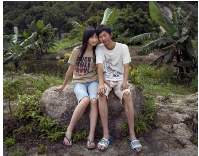
04_ Teenage Couple, Hengqin, Zhuhai 05/06/2007