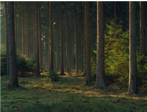
03_Heidegrund, Lüneburger Heide, 2015