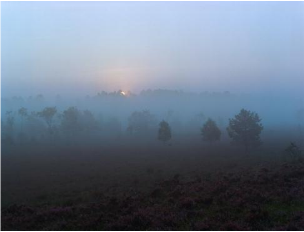
01_Suhorn, Lüneburger Heide, 2014