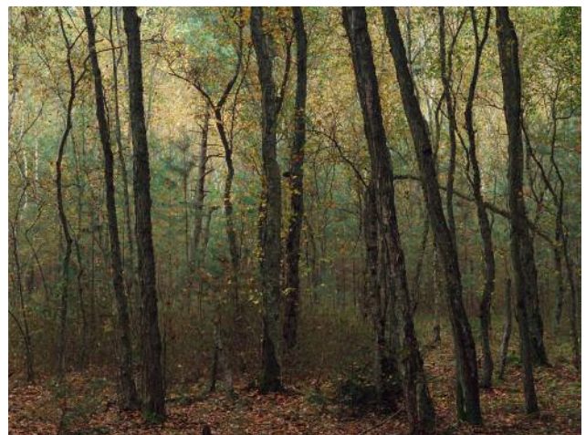
12_Fennweg Moor, Plagefenn, 2020