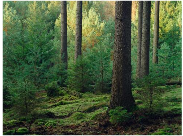
02_Osterheide, Lüneburger Heide, 2015