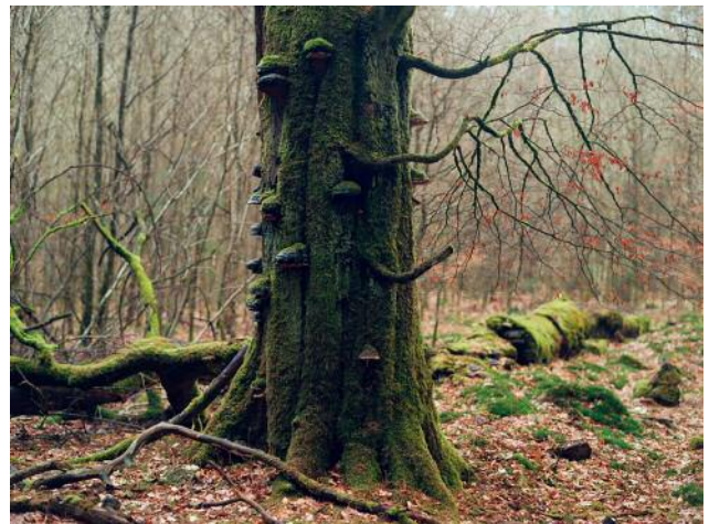
10_Friedrichsruh, Sachsenwald, 2016