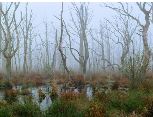
11_Osterwald, Vorpommersche Bodden, 2019