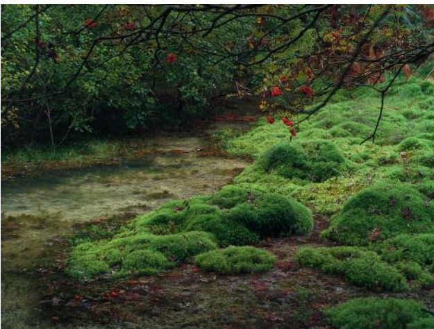
05_Beim Töps, Hanstedter Berge, 2015