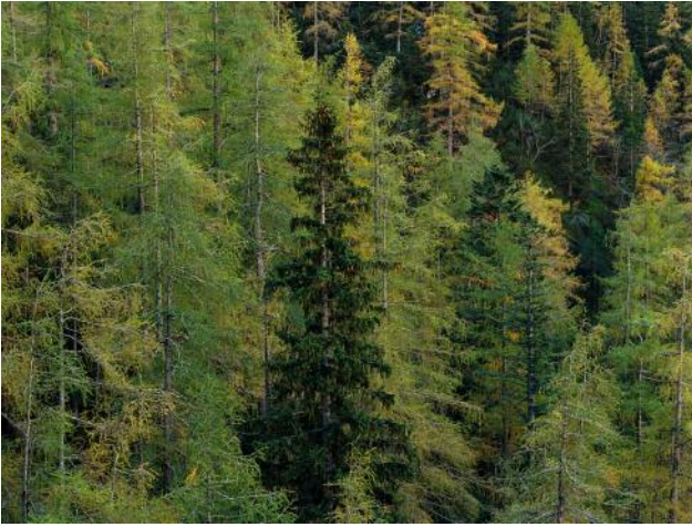
07_Blaue Schärtenwand, Berchtesgadener Land, 2016