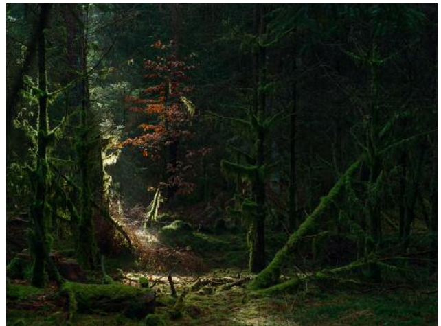
04_Wümme Unterholz, Lüneburger Heide, 2015