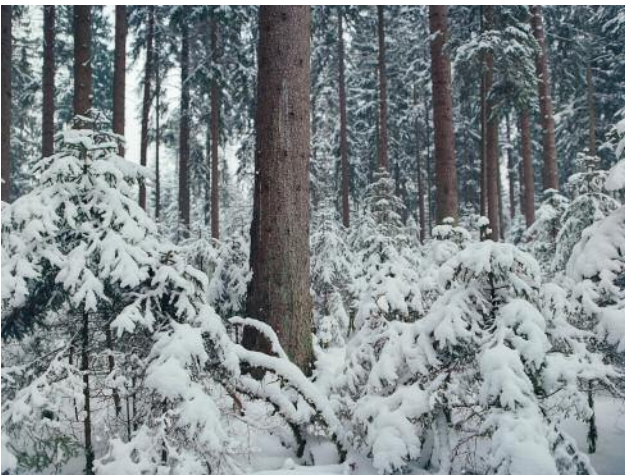
09_Winterheide, Lüneburger Heide, 2016