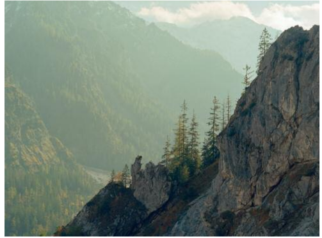
08_Wimbachtal, Berchtesgadener Land, 2016