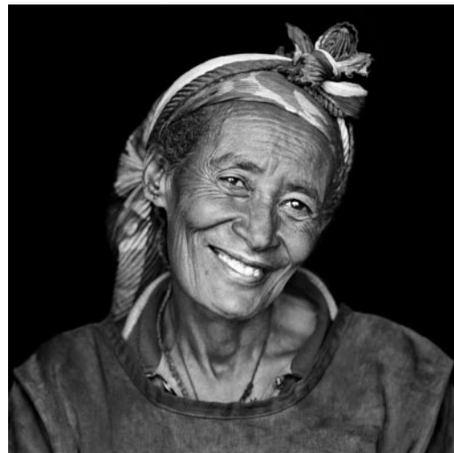
06_ Worldid oder „Black-Lady“, Kohlenhändlerin, Markt in Gondar, Äthiopien, 2011