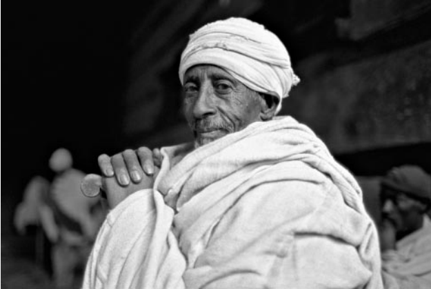
07_ Äthiopisch-orthodoxer Christ, im Norden von Lalibela, Äthiopien, 2011