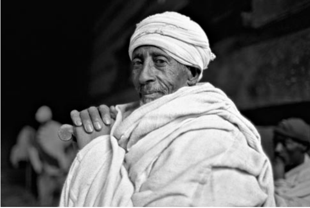
07_ Äthiopisch-orthodoxer Christ, im Norden von Lalibela, Äthiopien, 2011