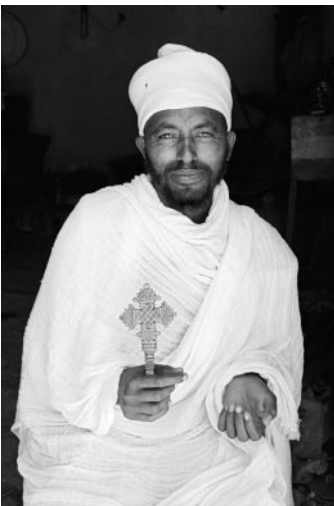
05_ Einem jungen Mönch, Äthiopien, 2011