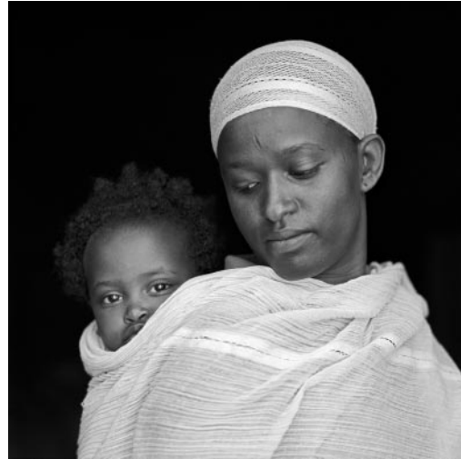
02_ Mutter und Kind, Gemeinschaft der Beta Israel, Gondar, Äthiopien, 2011