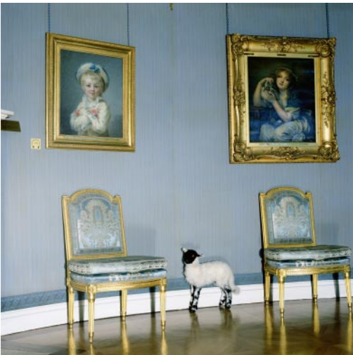
09_ What is Human? Wallace Collection, London, England, 2001 © Karen Knorr