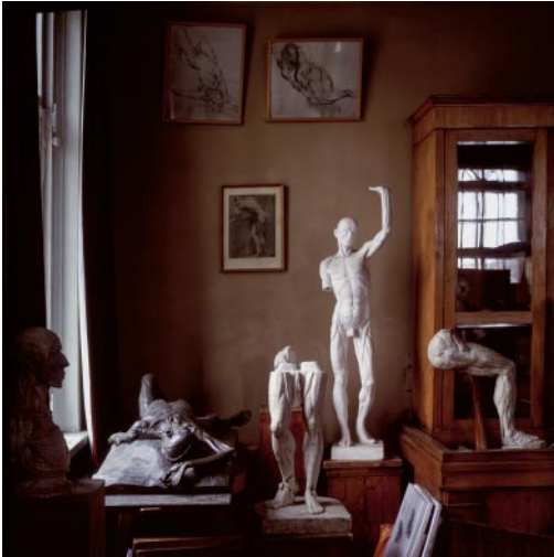
07_ The Anatomy Class Russian Academy of Arts, Saint Petersburg, Russia, 2004 © Karen Knorr