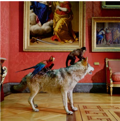
05_ High Art Life after the Deluge Wallace Collection, London, England, 2000