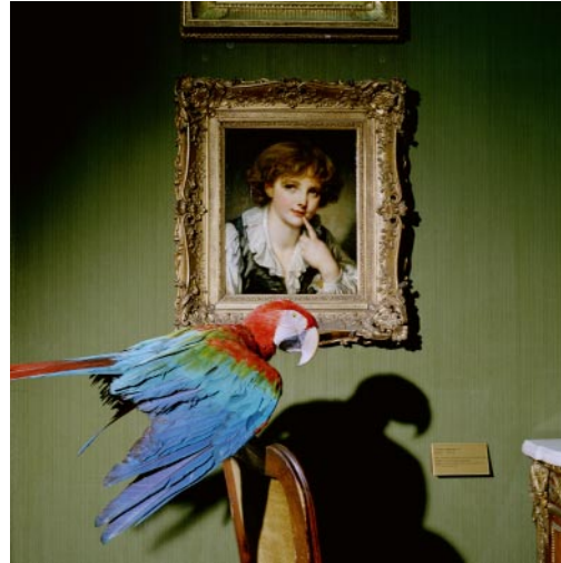
08_ Flaubert's Parrot Wallace Collection, London, England, 2001