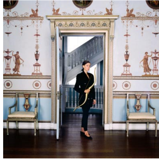
02_ Shattering an Old Dream of Symmetry Osterley Park and House, London, England, 1988