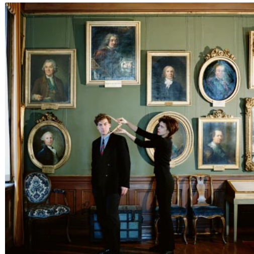
06_ Hårleman's Anatomy Royal Swedish Academy of Fine Arts, Stockholm, Sweden, 1994 © Karen Knorr