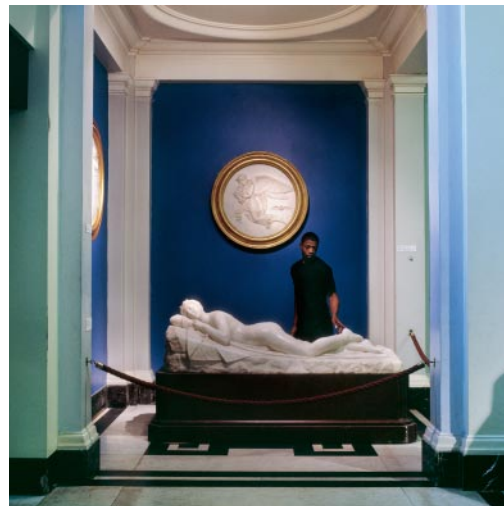
12_ Movement of the Soul Victoria and Albert Museum, London, England, 1994 © Karen Knorr