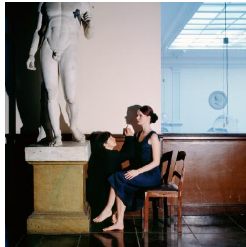
10_ Butade's Daughter Royal Swedish Academy of Fine Arts, Stockholm, Sweden, 1994