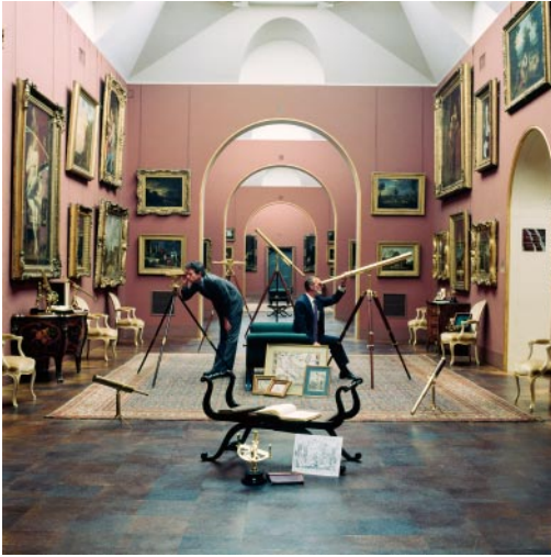
01_ The Analysis of Beauty Dulwich Picture Gallery, London, England, 1988 © Karen Knorr