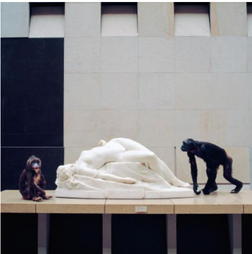
03_ The Artist, The Model, The Art Critic and The Spectator Musée d'Orsay, Paris, France, 1998 © Karen Knorr