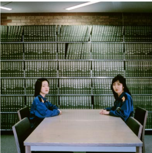
11_ Painters of Modern Life Goldsmiths, London, England, 1997 © Karen Knorr