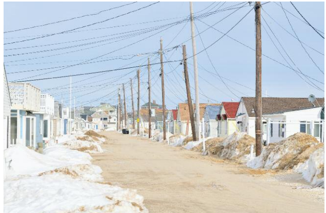
4 © DOUGLAS LJUNGKVIST