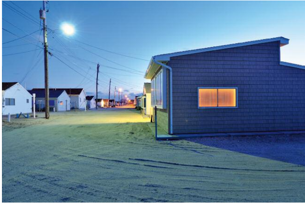
1 © DOUGLAS LJUNGKVIST