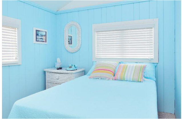
2 © DOUGLAS LJUNGKVIST