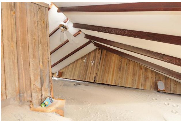
11 © DOUGLAS LJUNGKVIST