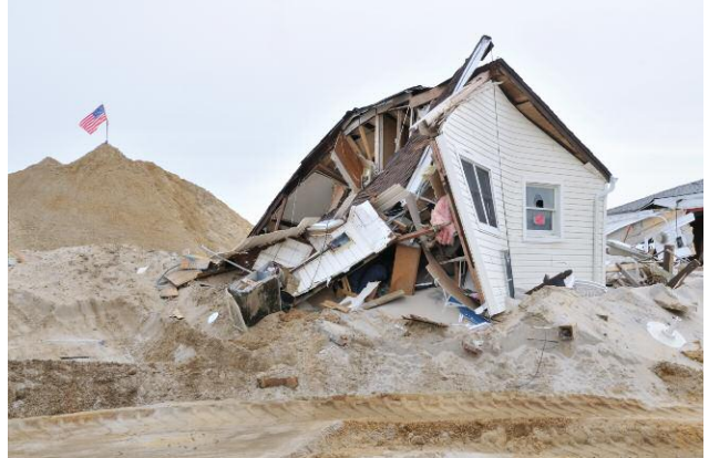
8 © DOUGLAS LJUNGKVIST