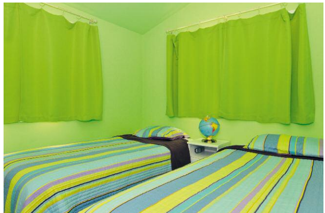
6 © DOUGLAS LJUNGKVIST