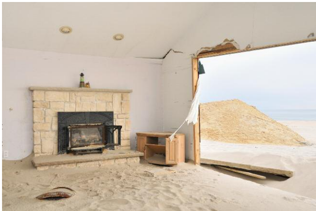
9 © DOUGLAS LJUNGKVIST