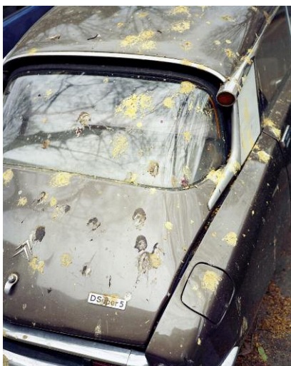
Pressebild 5