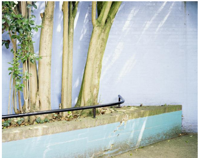
Pressebild 10