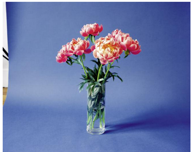
Pressebild 4