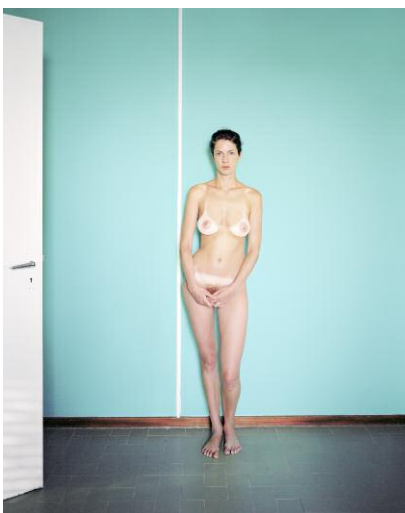
Pressebild 11