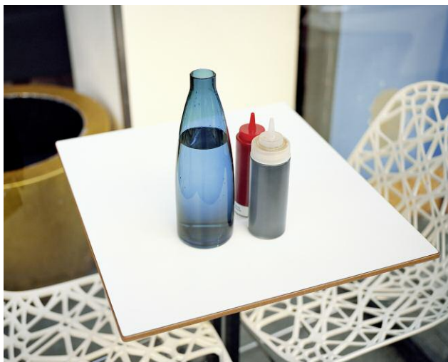
Pressebild 3