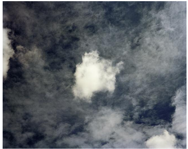
Pressebild 2