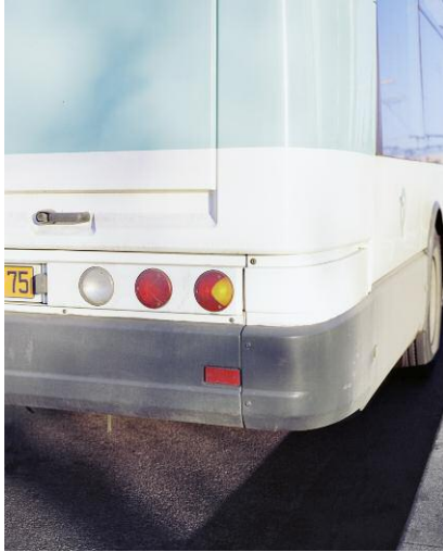
Pressebild 1 © MARTIN ESSL