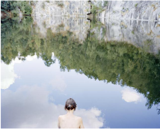
Pressebild 7