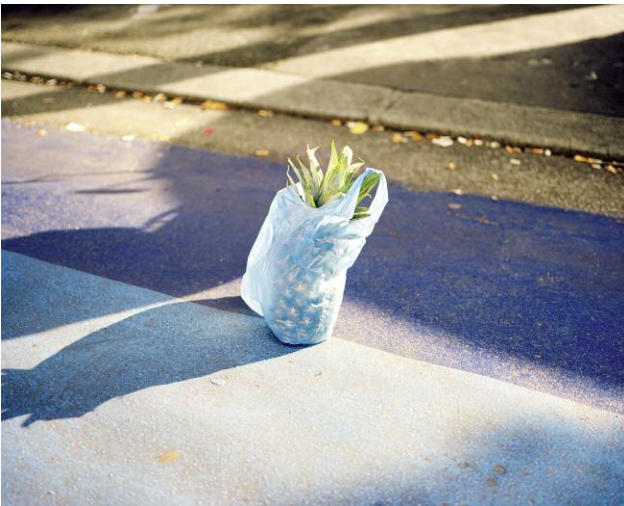
Pressebild 9