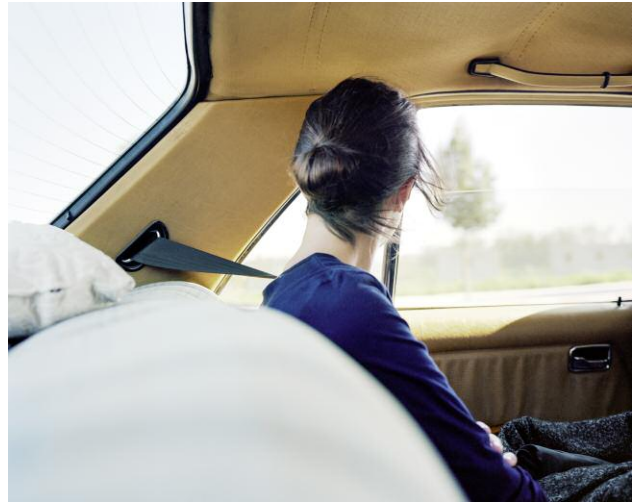
Pressebild 8