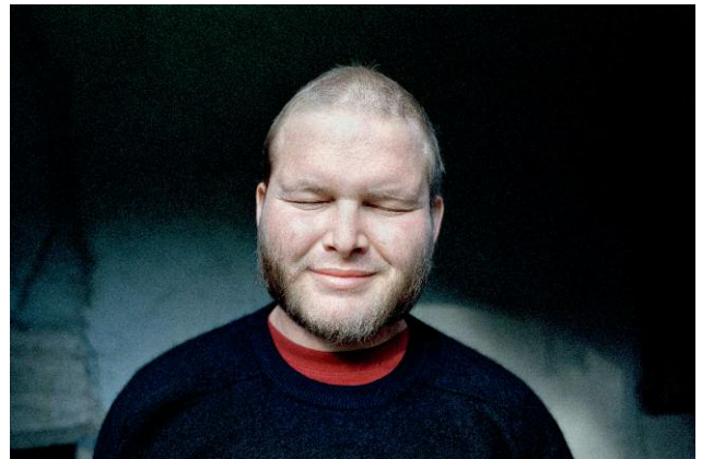
Henri 26.08.08, CHUV