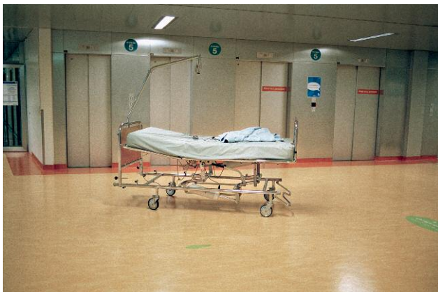
Niveau 5 20.10.08, HUG