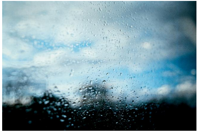
La Pluie 2009