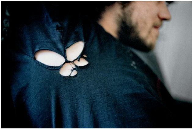
Le Papillon 03.08.09, Yverdon