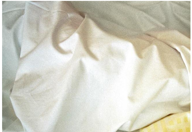
Les Blouses vertes 20.10.08, HUG