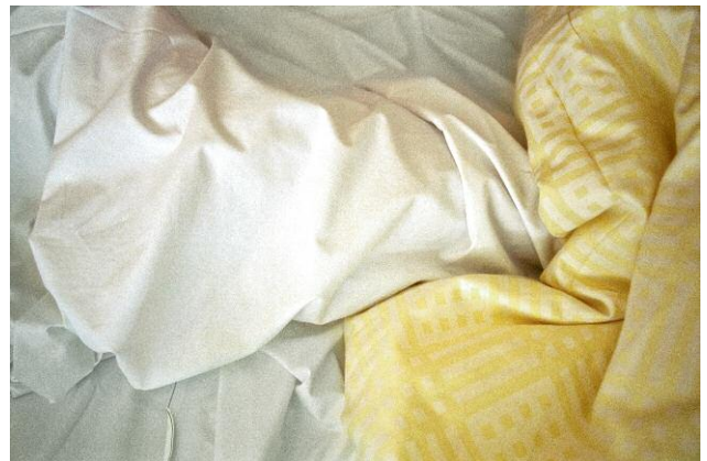
La Larve 11.05.09, CHUV