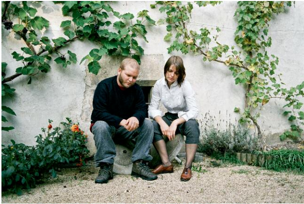
Autoportrait avec Henri 26.08.08, Yverdon